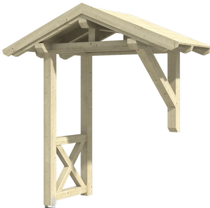
VORDACH SIEGEN 3 247 x 116 cm

Massive Konstruktion aus Konstruktionsvollholz (KVH-Fichte)