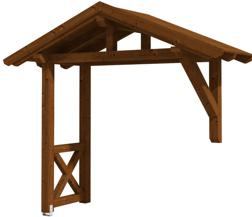
VORDACH STRALSUND 3 289 x 116 cm

Massive Konstruktion aus Konstruktionsvollholz (KVH-Fichte)