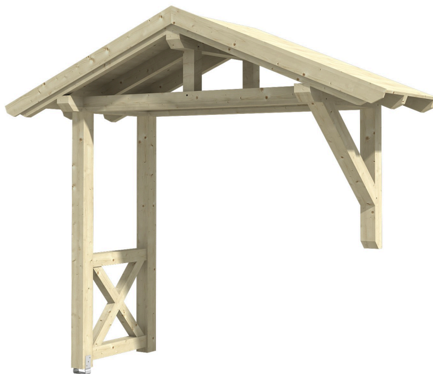
VORDACH STRALSUND 3 289 x 116 cm

Massive Konstruktion aus Konstruktionsvollholz (KVH-Fichte)