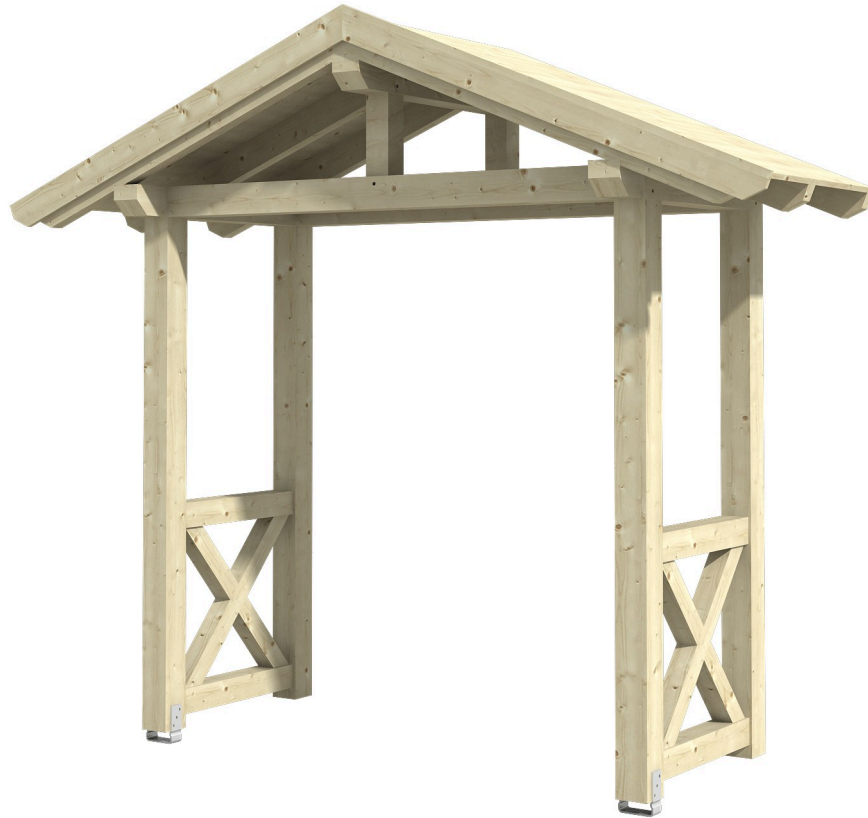
VORDACH STRALSUND 4 289 x 116 cm

Massive Konstruktion aus Konstruktionsvollholz (KVH-Fichte)