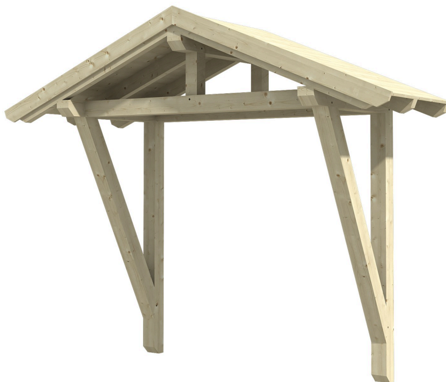
VORDACH STRALSUND 2 289 x 116 cm

Massive Konstruktion aus Konstruktionsvollholz (KVH-Fichte)