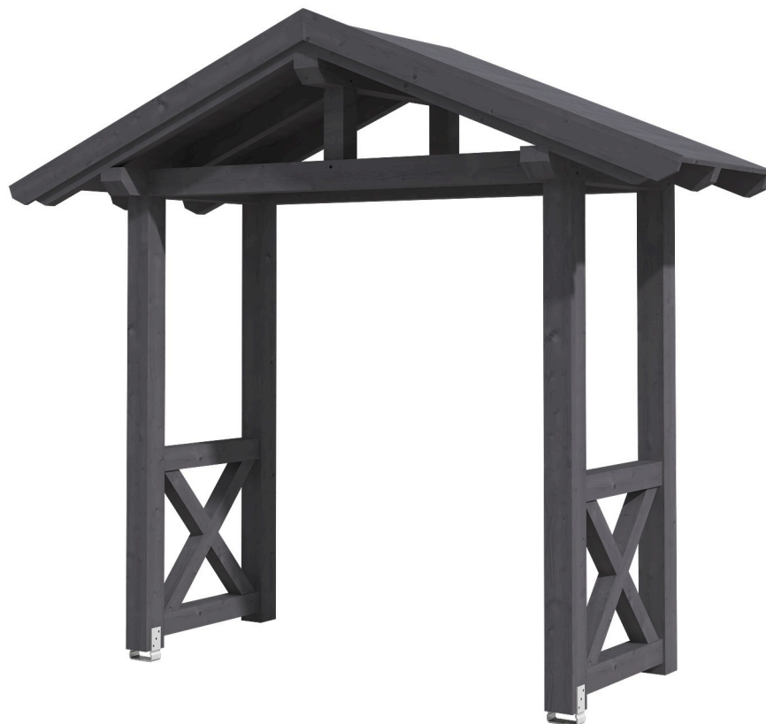
VORDACH STRALSUND 4 289 x 116 cm

Massive Konstruktion aus Konstruktionsvollholz (KVH-Fichte)