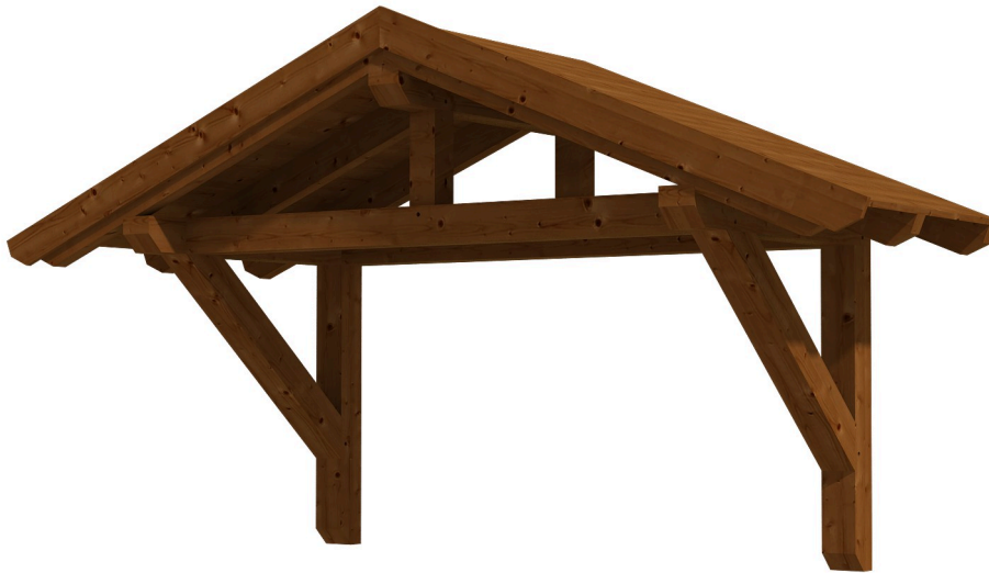
VORDACH STRALSUND 1 289 x 116 cm

Massive Konstruktion aus Konstruktionsvollholz (KVH-Fichte)