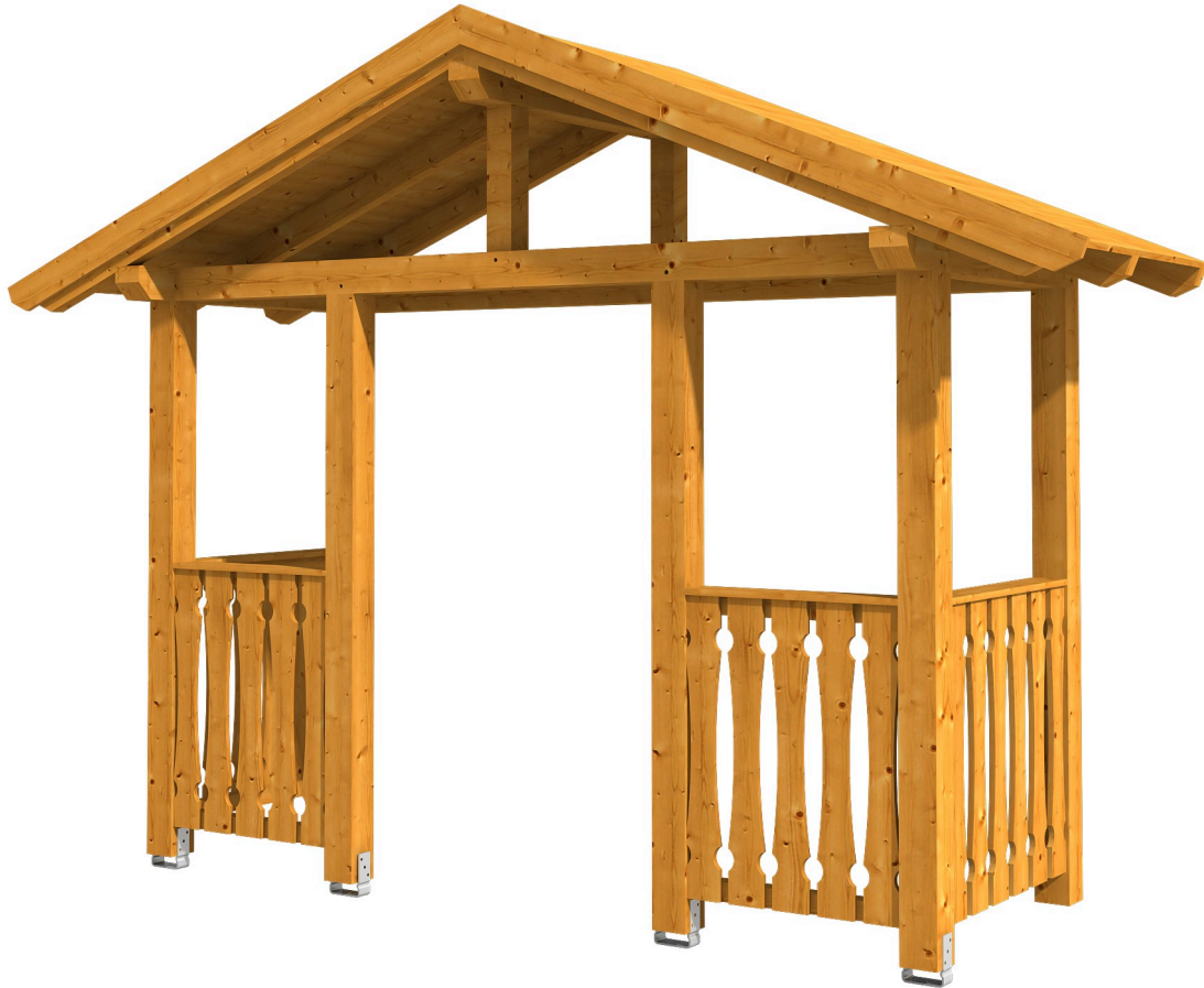
VORDACH STRALSUND 6 360 x 139 cm

Massive Konstruktion aus Konstruktionsvollholz (KVH-Fichte)