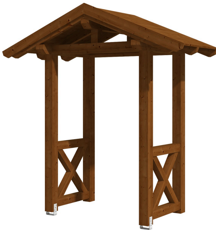
VORDACH SIEGEN 4 247 x 116 cm

Massive Konstruktion aus Konstruktionsvollholz (KVH-Fichte)