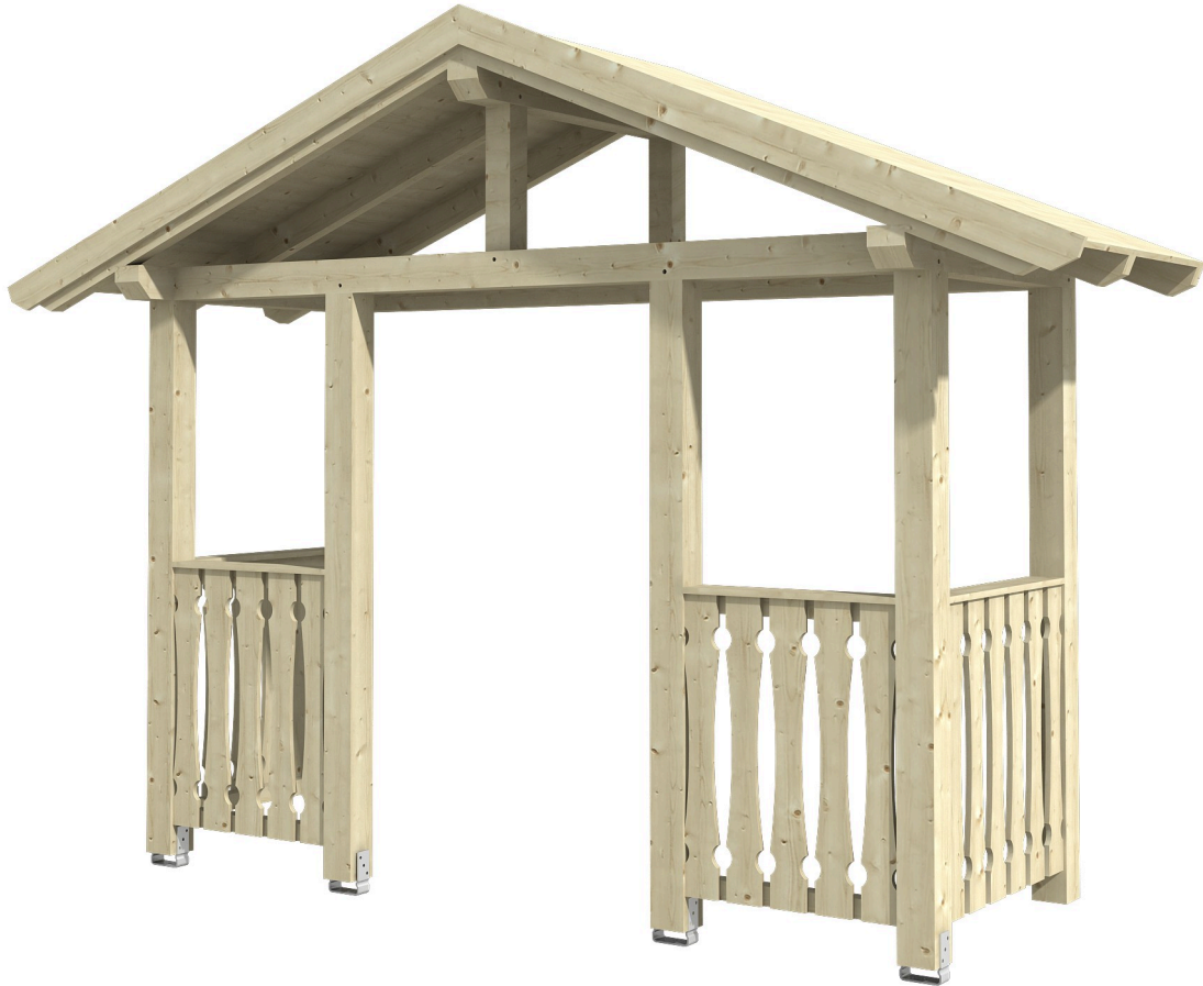
VORDACH STRALSUND 6 360 x 139 cm

Massive Konstruktion aus Konstruktionsvollholz (KVH-Fichte)