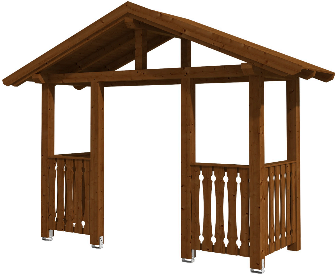
VORDACH STRALSUND 6 360 x 139 cm

Massive Konstruktion aus Konstruktionsvollholz (KVH-Fichte)