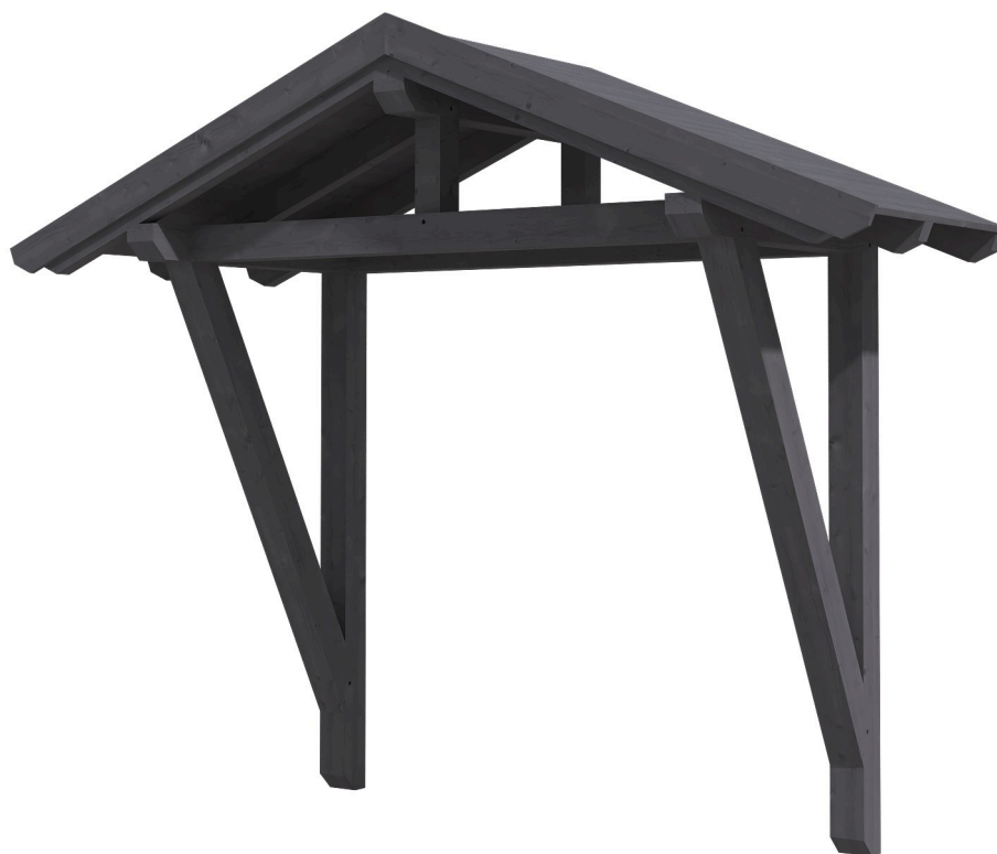
VORDACH STRALSUND 2 289 x 116 cm

Massive Konstruktion aus Konstruktionsvollholz (KVH-Fichte)