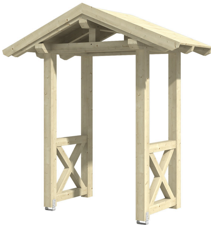
VORDACH SIEGEN 4 247 x 116 cm

Massive Konstruktion aus Konstruktionsvollholz (KVH-Fichte)