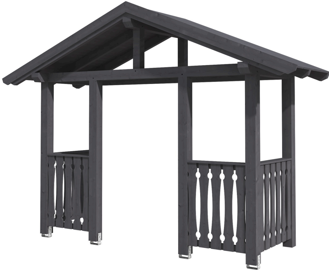
VORDACH STRALSUND 6 360 x 139 cm

Massive Konstruktion aus Konstruktionsvollholz (KVH-Fichte)