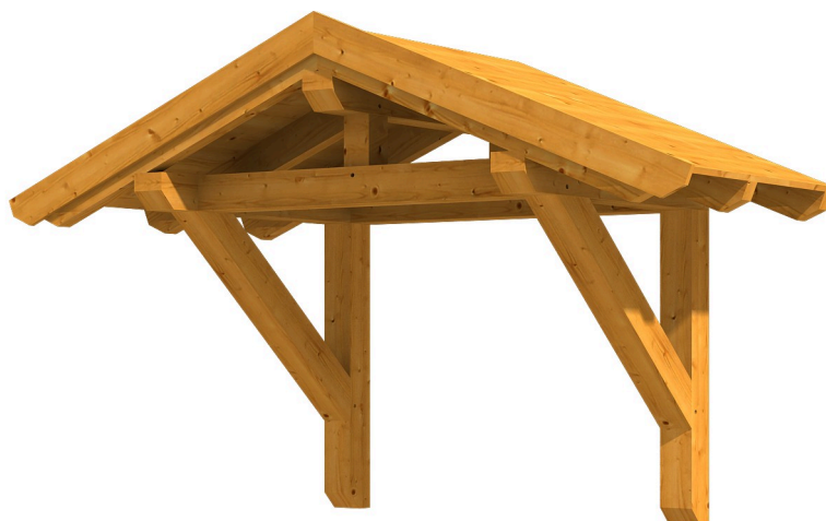
VORDACH SIEGEN 1 247 x 116 cm

Massive Konstruktion aus Konstruktionsvollholz (KVH-Fichte)