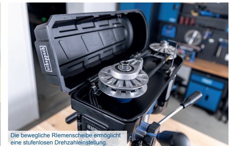
Die bewegliche Riemenscheibe ermöglicht eine stufenlosen Drehzahleinstellung.