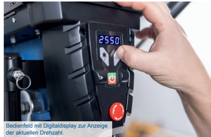
Bedienfeld mit Digitaldisplay zur Anzeige der aktuellen Drehzahl.