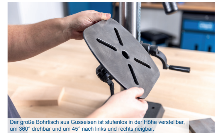
Der große Bohrtisch aus Gusseisen ist stufenlos in der Höhe verstellbar, um 360° drehbar und um 45° nach links und rechts neigbar.