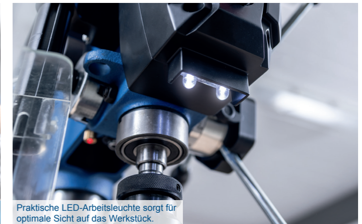
Praktische LED-Arbeitsleuchte sorgt für optimale Sicht auf das Werkstück.