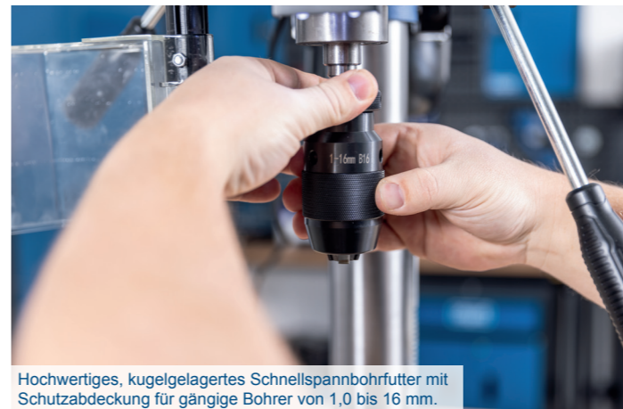
Hochwertiges, kugelgelagertes Schnellspannbohrfutter mit Schutzabdeckung für gängige Bohrer von 1,0 bis 16 mm.