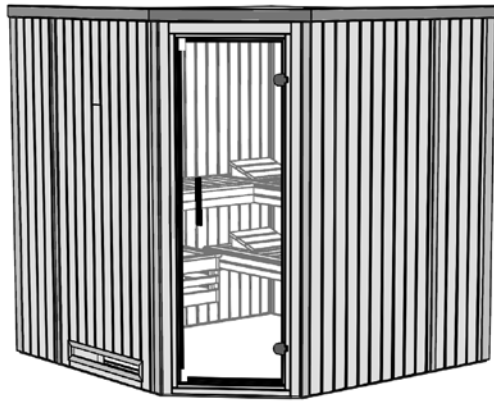
Maße in cm