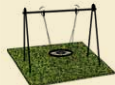
Im Spielbereich – schützt den Boden