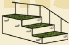
Treppen im Außenbereich