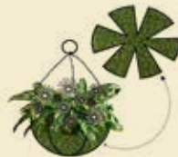
Als kreatives Pflanzgefäß