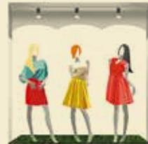
Als Schaufensterdeko – optisches Highlight