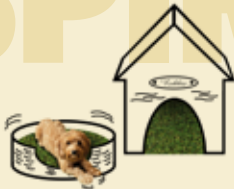
Für den Lieblingsplatz des Haustiers