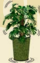
Verschönert alte Blumentöpfe