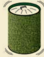
Verschönerung der Mülltonnen