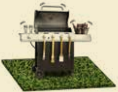
Für den Grillbereich