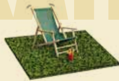
Für Picknick oder Sundowner