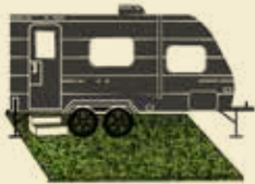
Untergrund für Wohnwagen und -mobile