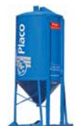
Silos (a granel)