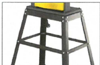
Base included Base incluida