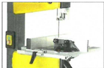
Aluminium tilting table up to 45°, goniometer include Mesa de trabajo en aluminio, inclinable hasta 45°, goniómetro incluido