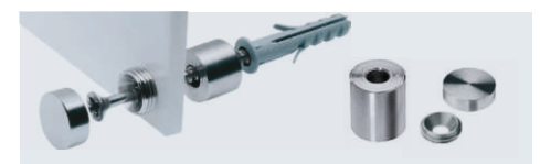
Optionales Verlegezubehör: Zierkappen und Abstandhalter aus Edelstahl