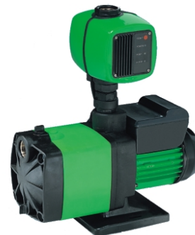
Pumpe Kreisel 4/1000