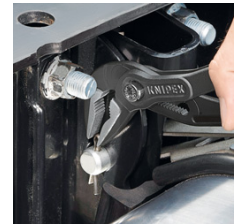
Optimaler Zugang zum Werkstück. Ideal für Service und Instandhaltung, Gerätereparatur, Fahrzeugbereich und Industrie