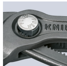
Feinverstellung per Druckknopf: schnell und komfortabel

Technische Änderungen und Irrtümer vorbehalten