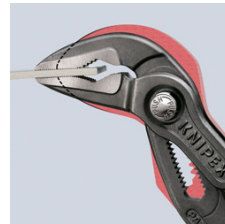
Sehr schlanke Bauform im gesamten Kopf- und Gelenkbereich (im Vergleich zu konventionellen Wasserpumpenzangen)