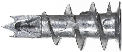
Gipskartondübel Metall GKM