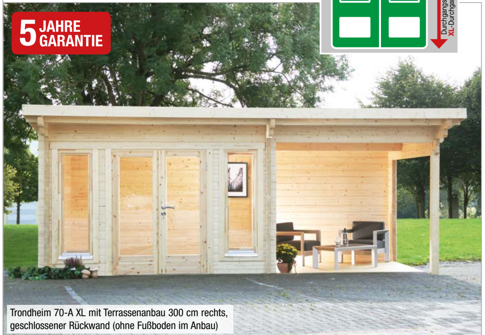
Trondheim 70-A XL mit Terrassenanbau 300 cm rechts, geschlossener Rückwand (ohne Fußboden im Anbau)