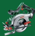
PKS 18 LI