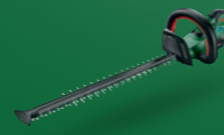
AHS 50-20 LI