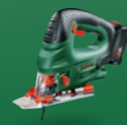
PST 18 LI