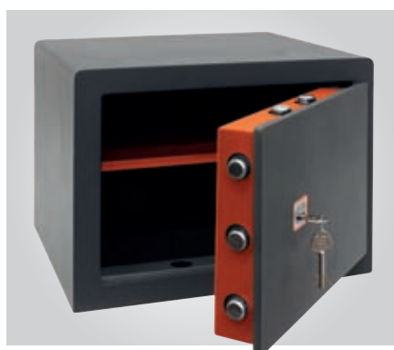
Bulones giratorios y guiados, que impiden su corte desde el exterior