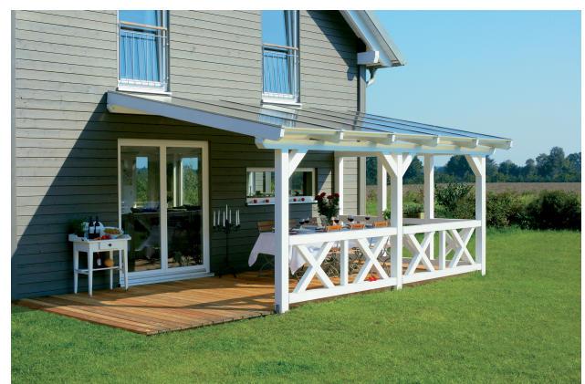
Kundenfoto: Terrassenüberdachung weiss mit 2 Brüstungen und Seitenwand