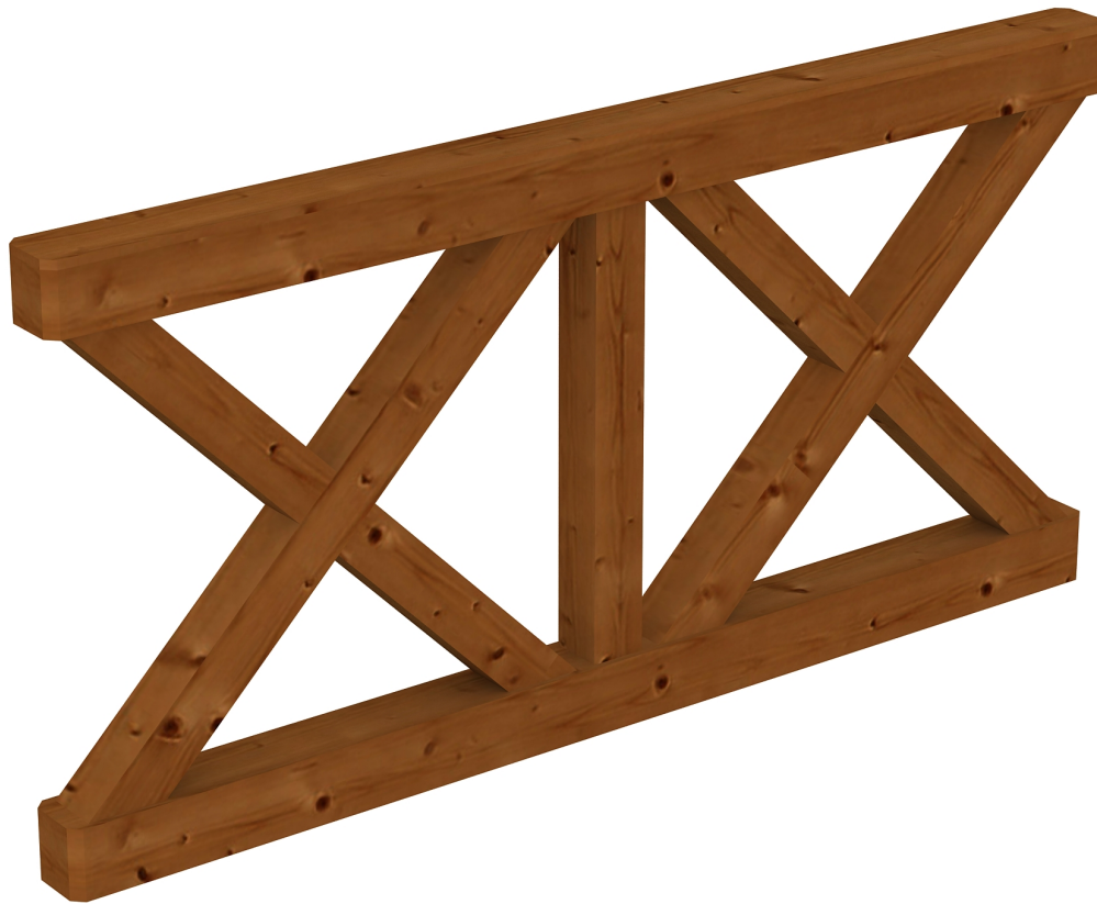
Produktbild AK-Brüstung 170cm