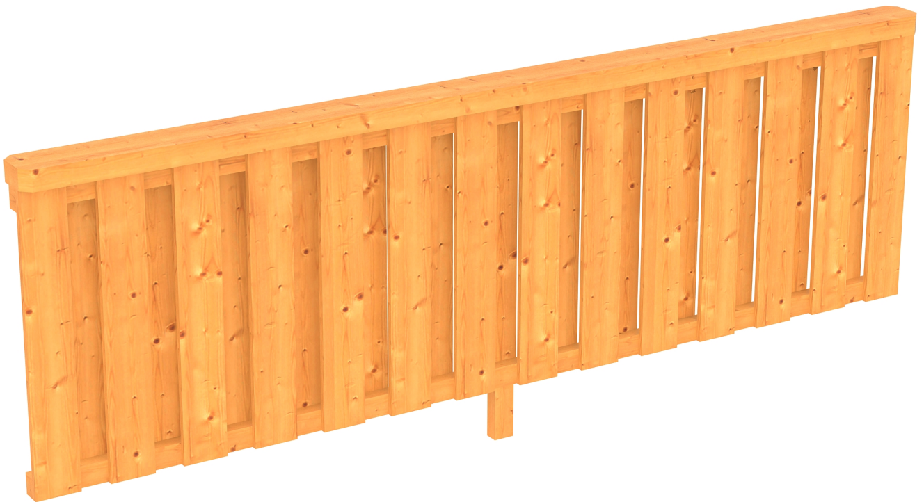
Produktbild Brüstung Deckelschlung 270cm