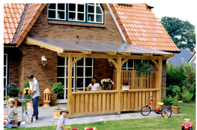
Kundenfoto: Terrassenüberdachung mit Brüstungen und Seitenwand