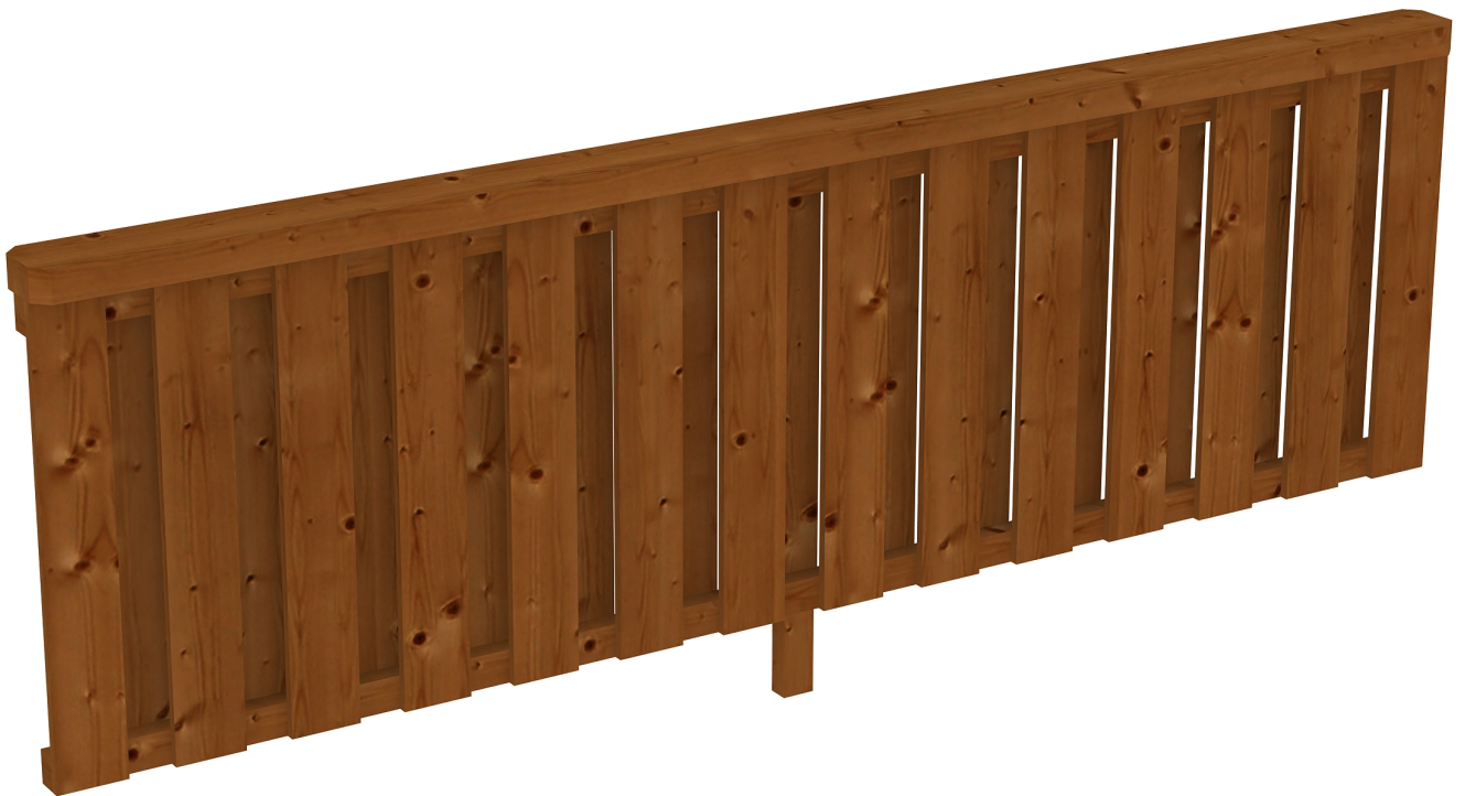
Produktbild Brüstung Deckelschlung 270cm