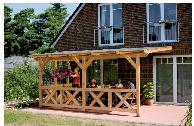
Kundenfoto: Terrassenüberdachung mit Brüstungen und Seitenwand