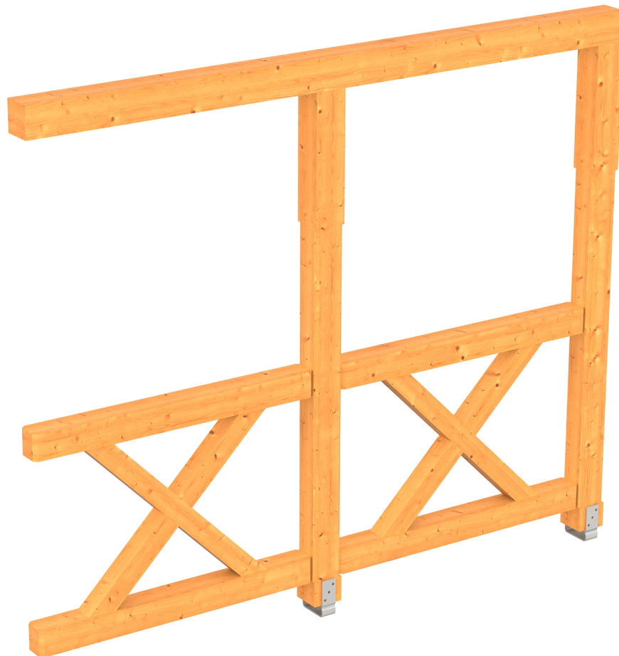
Produktbild AK-Seitenwand 255cm