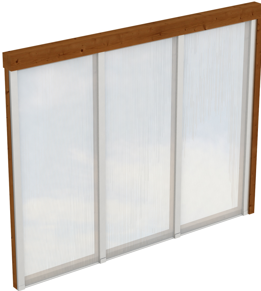
Produktbild Polycarbonat-Seitenwand 255cm