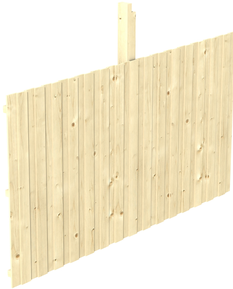
Produktbild Rückwand Deckelschalung