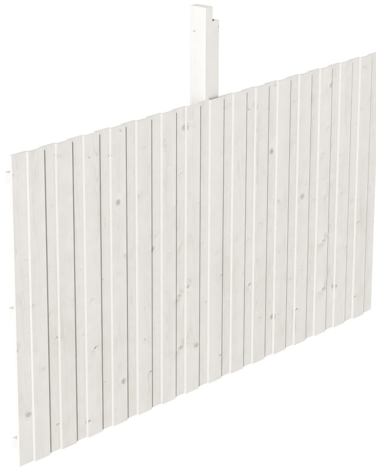
Produktbild Rückwand Deckelschalung