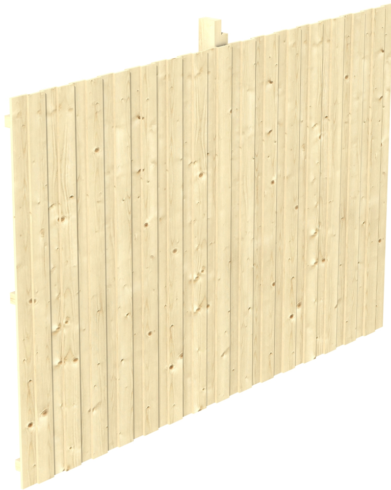
Produktbild Rückwand Deckelschalung