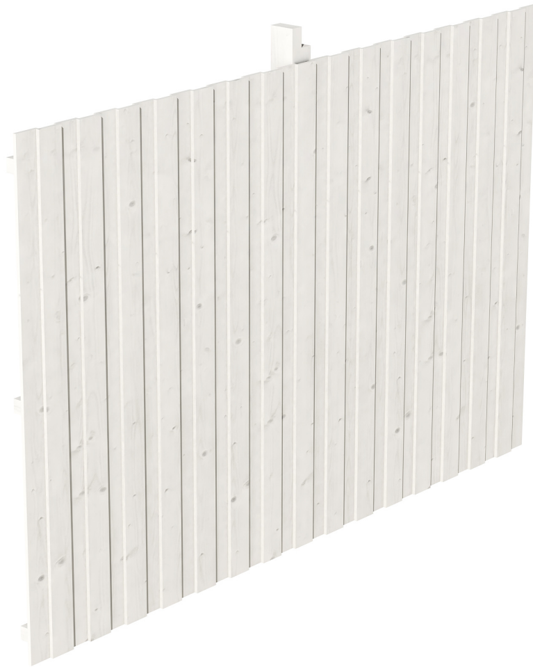
Produktbild Rückwand Deckelschalung