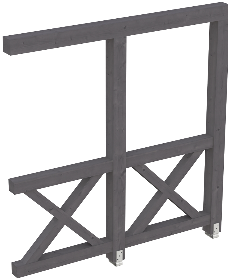
Produktbild AK-Seitenwand 205cm