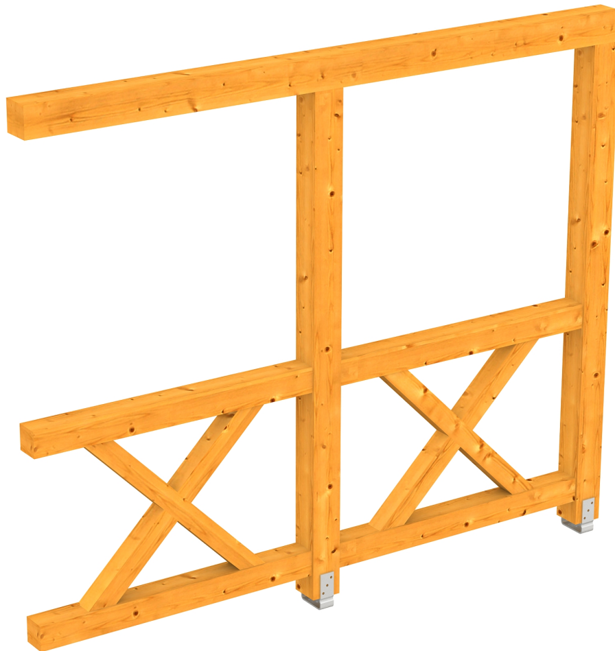
Produktbild AK-Seitenwand 255cm