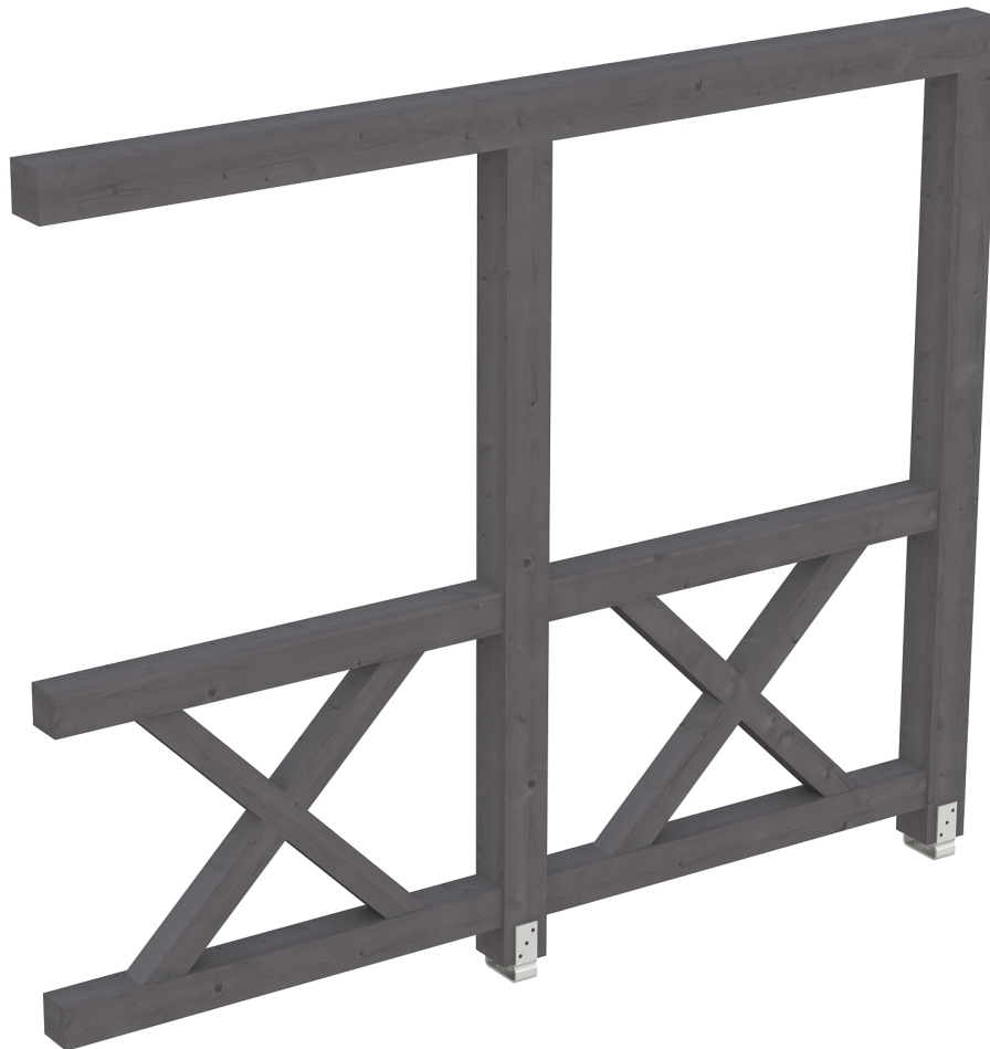
Produktbild AK-Seitenwand 255cm