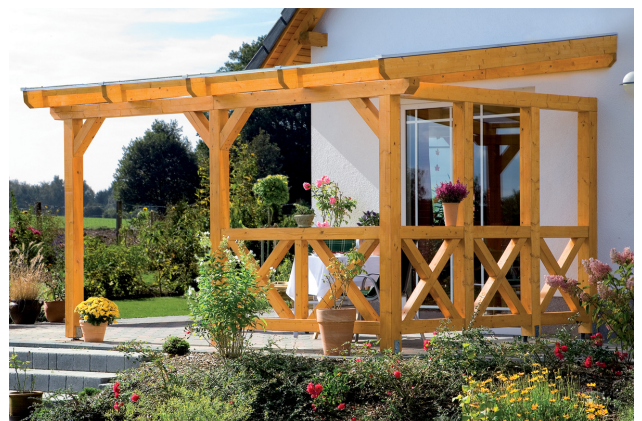
Kundenfoto: Terrassenüberdachung mit einer Brüstung und Seitenwand