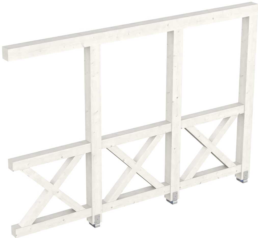
Produktbild AK-Seitenwand 305cm