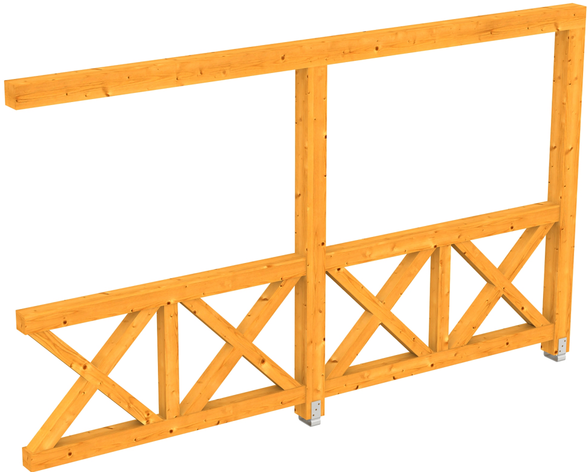
Produktbild AK-Seitenwand 355cm