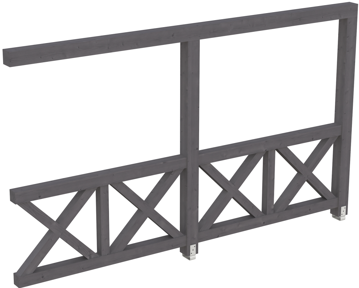
Produktbild AK-Seitenwand 355cm