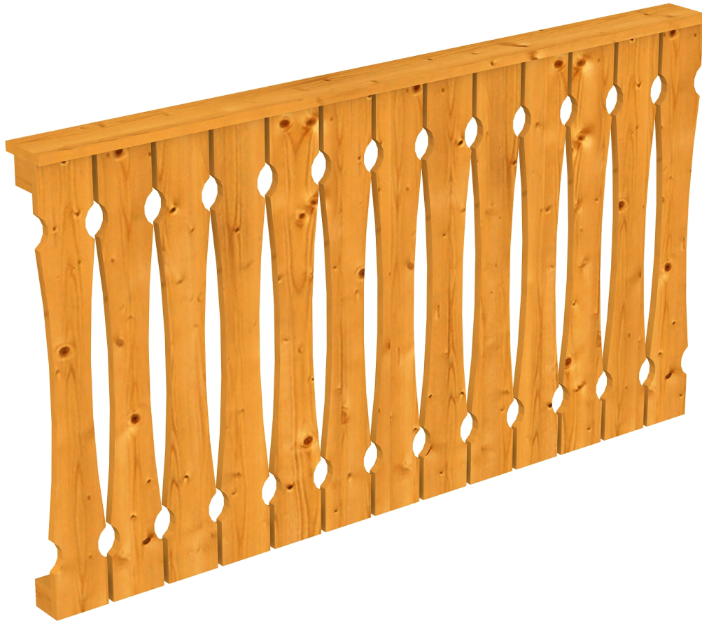
Produktbild AK-Brüstung 170cm