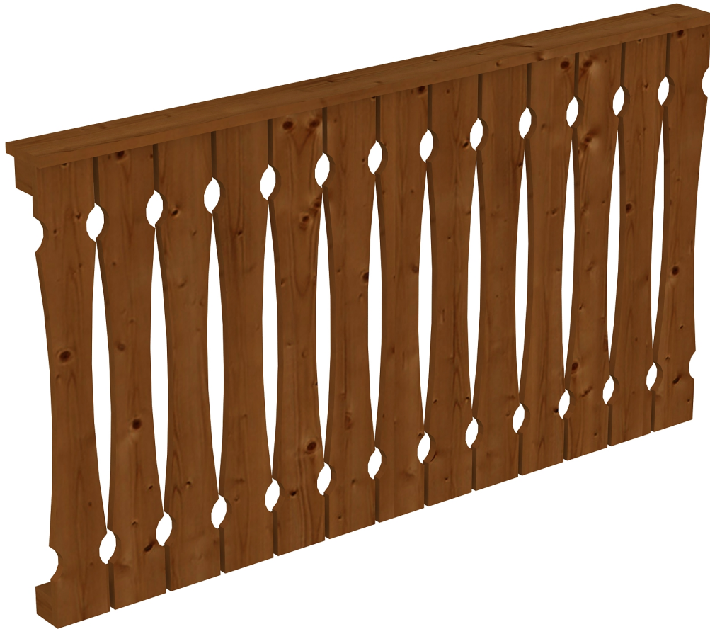
Produktbild AK-Brüstung 170cm