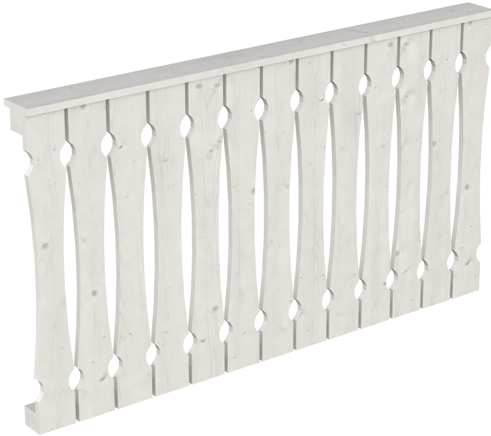
Produktbild AK-Brüstung 170cm