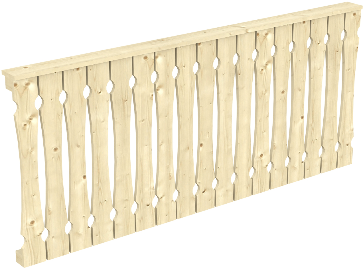
Produktbild AK-Brüstung 220cm