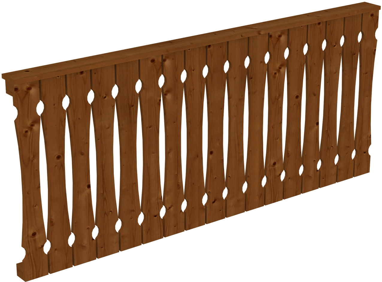
Produktbild AK-Brüstung 220cm