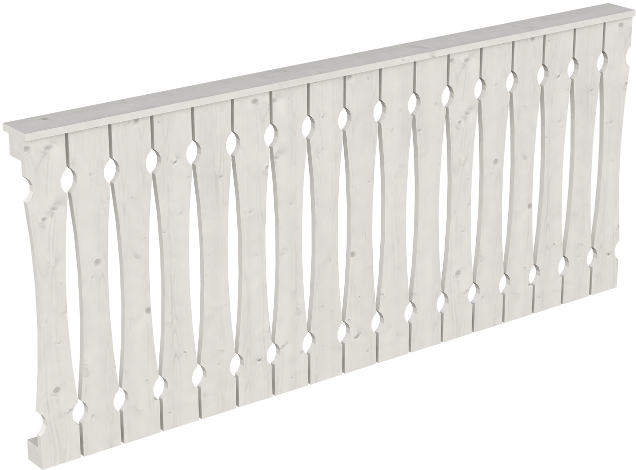
Produktbild AK-Brüstung 220cm